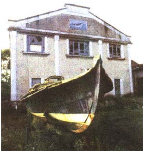
Fig.1 Bâtiment principal