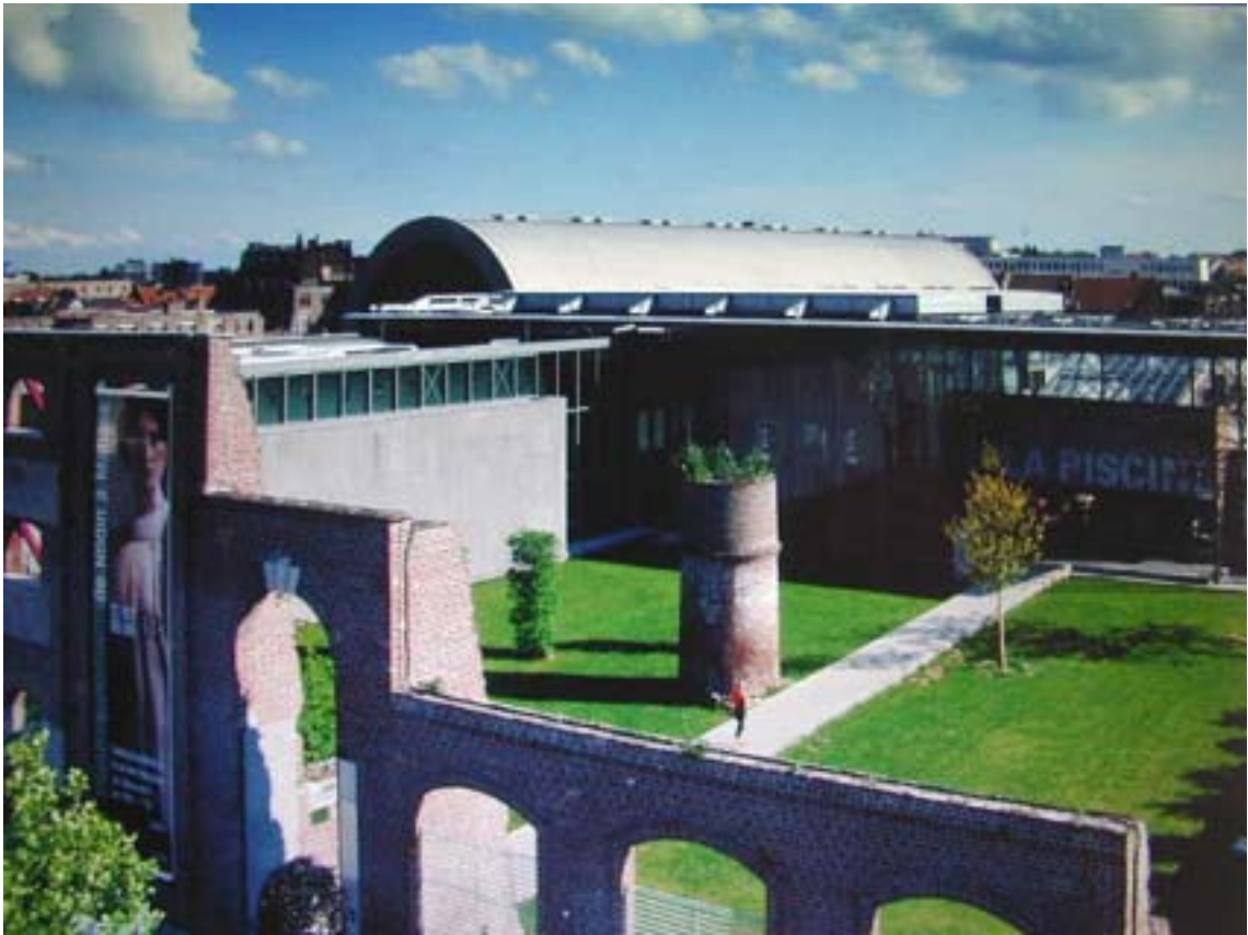
Fig.2 Vista d'insieme