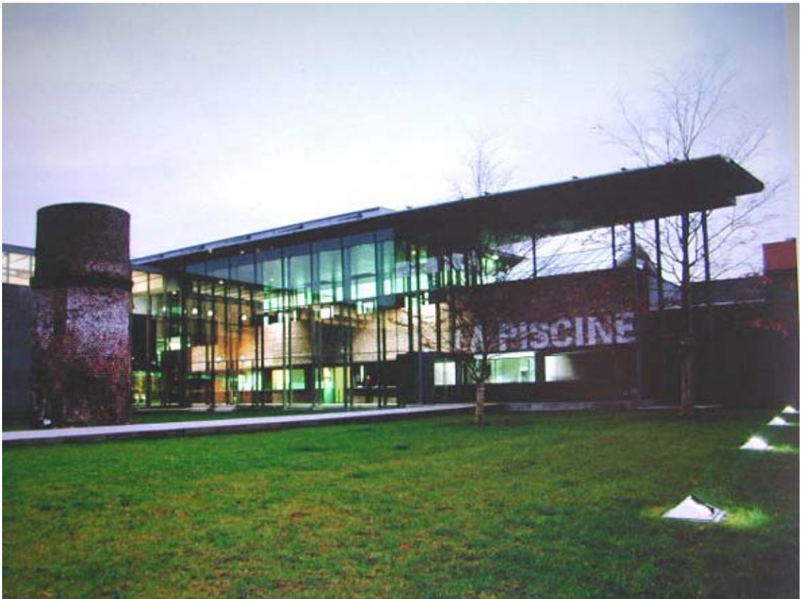
Fig.3 Il giardino di ingresso