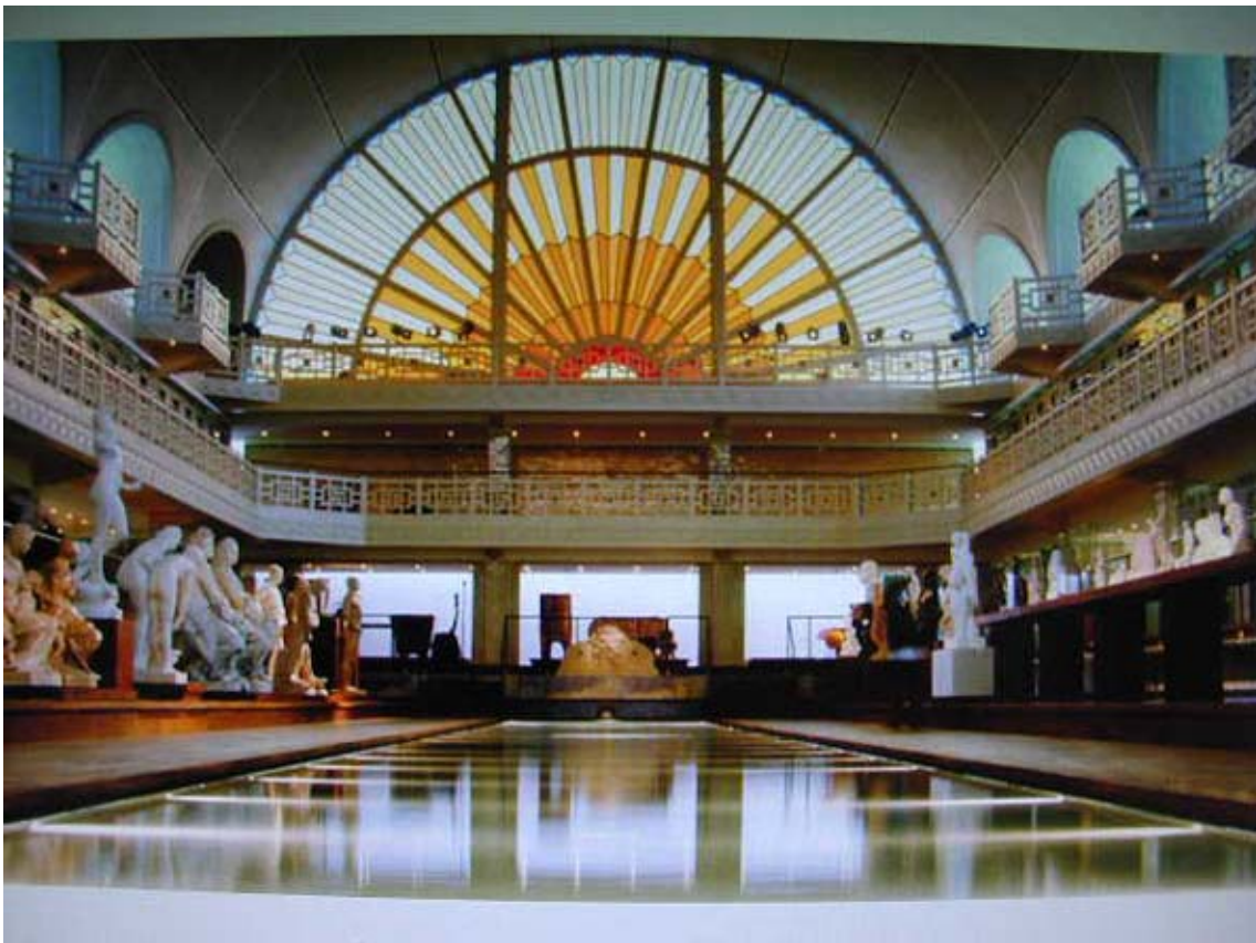
Fig.5 La piscina oggi