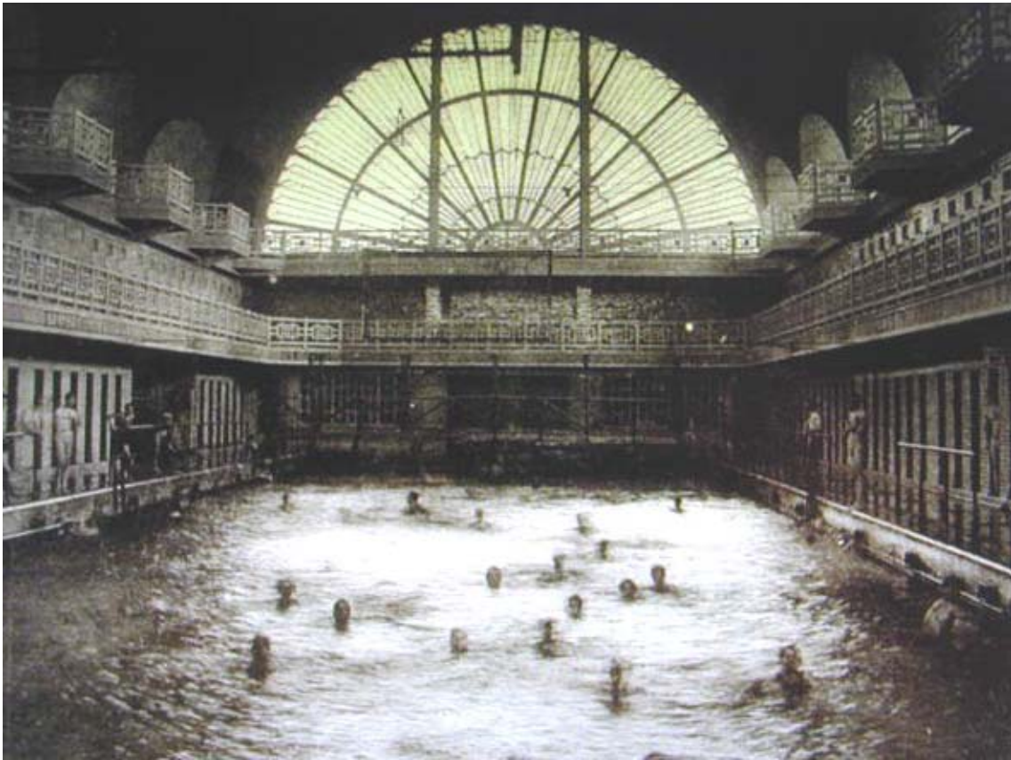
Fig.4 La piscina (com'era)