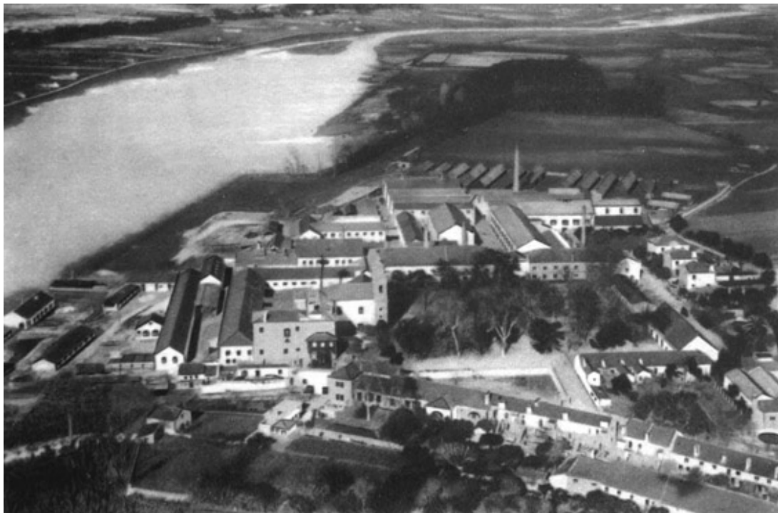
2. Vista aerea del sito