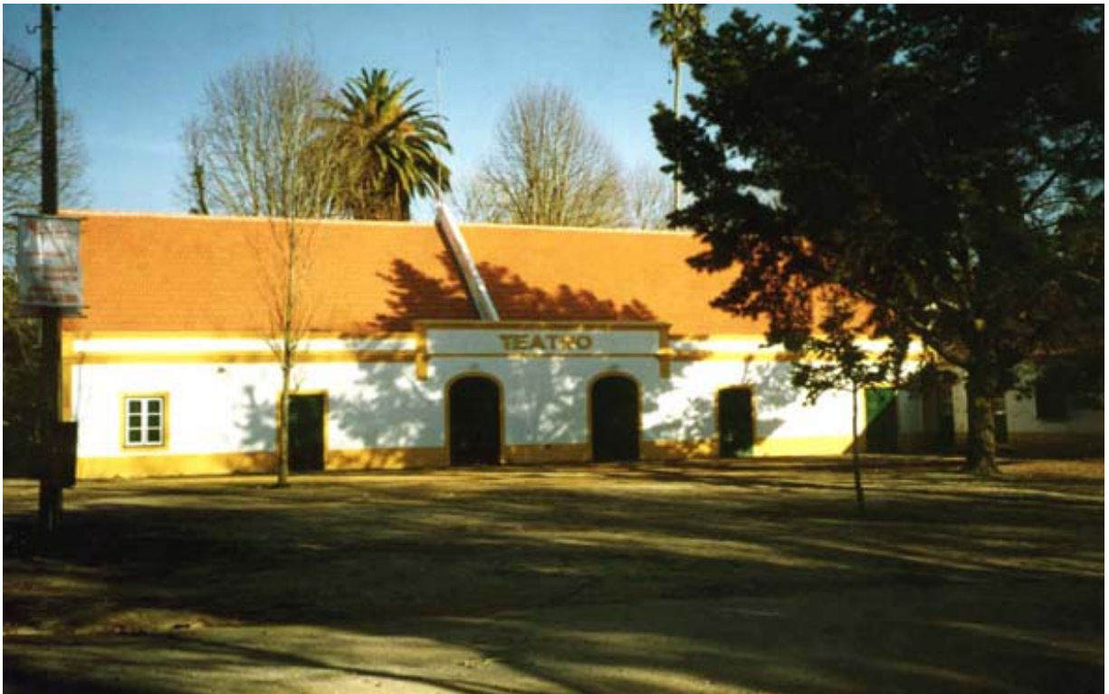
5. Il Teatro