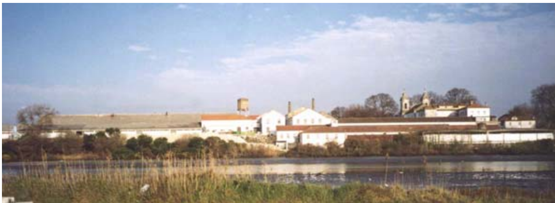
1. Il sito visto dal fiume

Arch. Óscar GRAÇA Settembre 2003 – con la collaborazione di Sindnova-Roma.