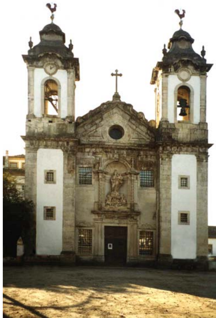
4. La chiesetta