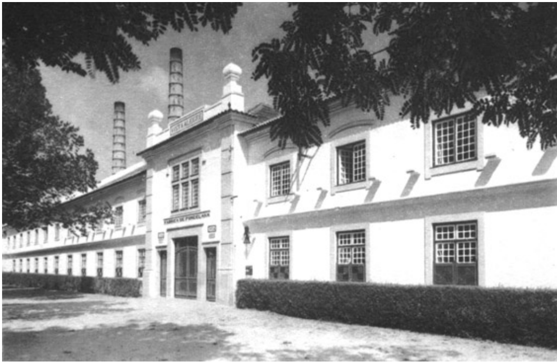
3. Edificio principale