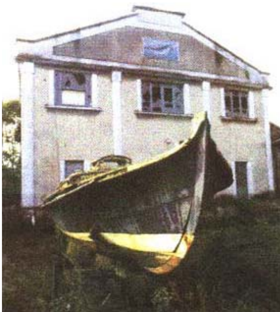
Fig.1 Edifício Principal