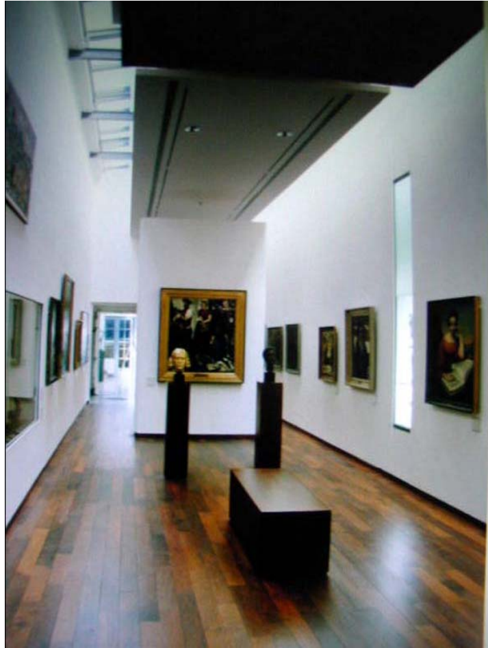
Fig.5 Uma das salas de exposição