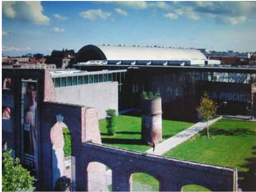
Fig.2 Vista geral