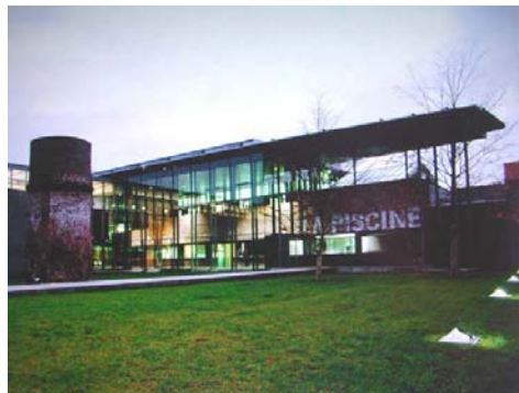
Jardim da Entrada