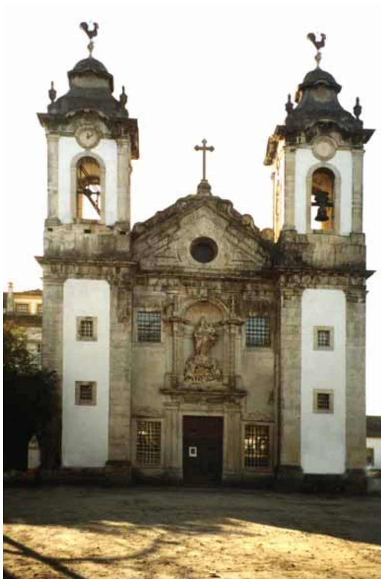
4. capela da fabrica