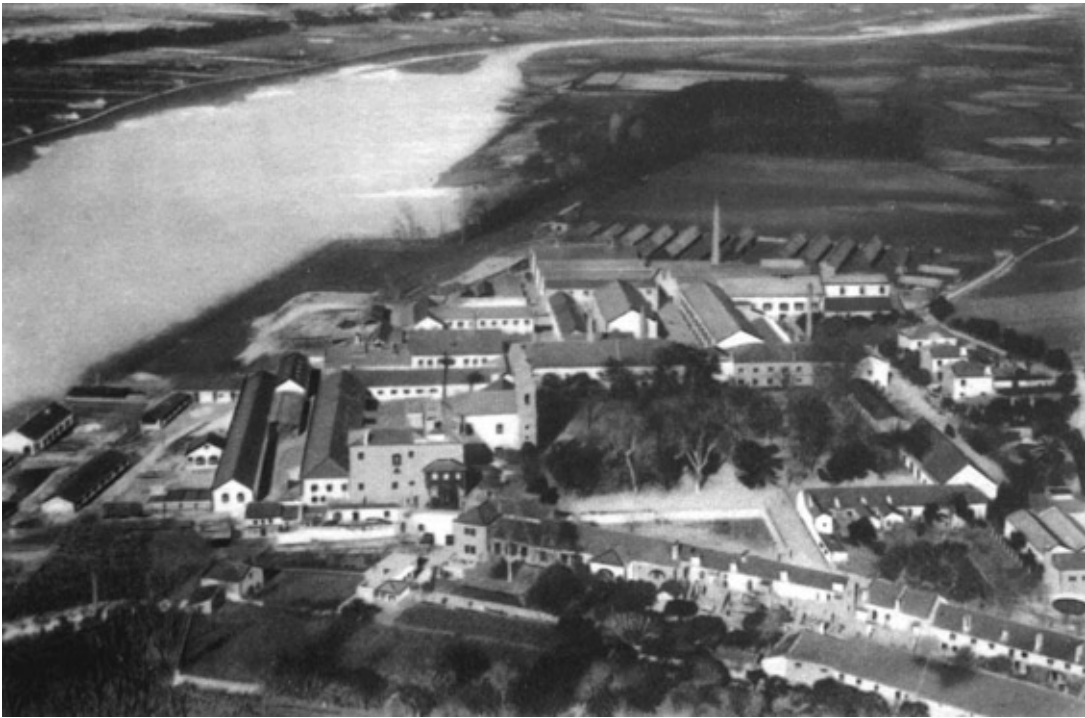
2. vista aerea