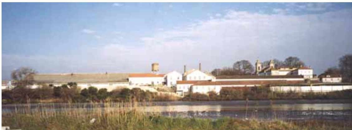
1. vista geral