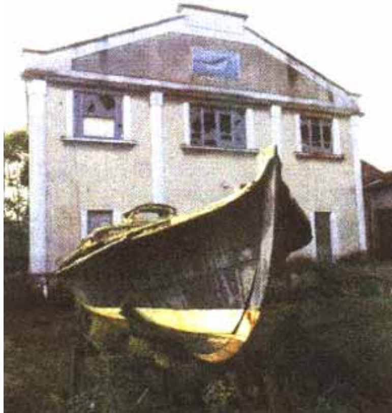
Fig.1 Clădirea principală