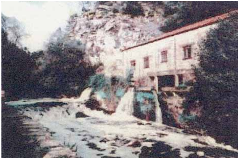
2. Vedere a clădirii principale