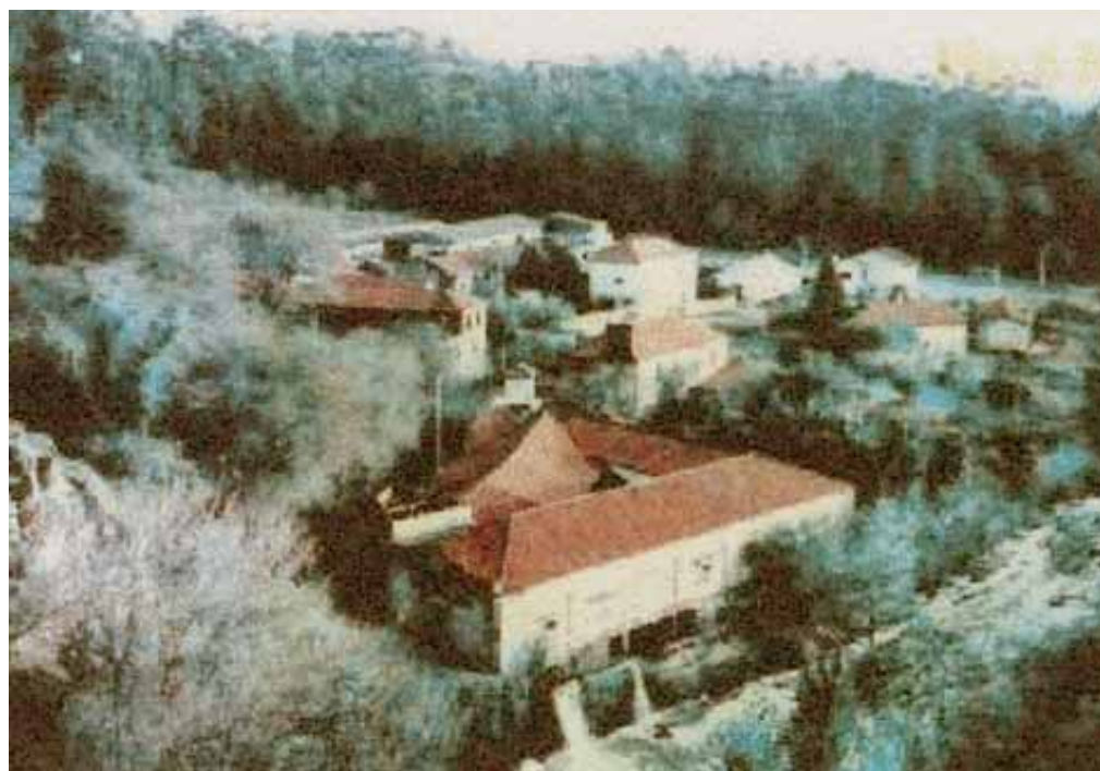
1 Vedere aeriană a sitului

Sandra de MAGALHAES CAMPOS - Septembrie, 2003