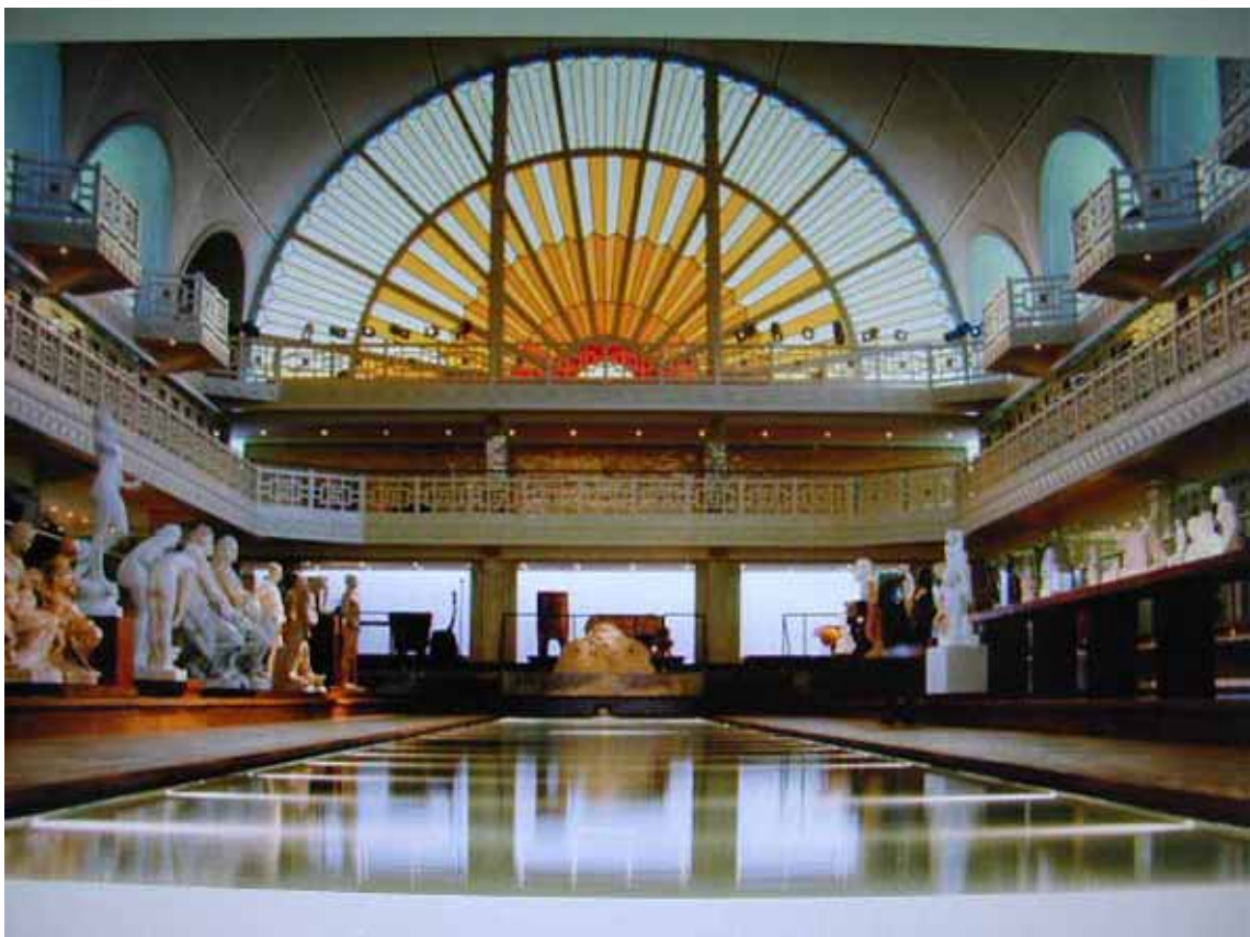
Fig.5 Piscina astăzi