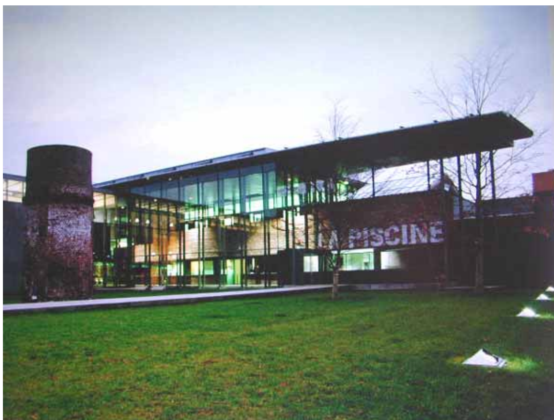
Fig.3 Grădina de la intrare