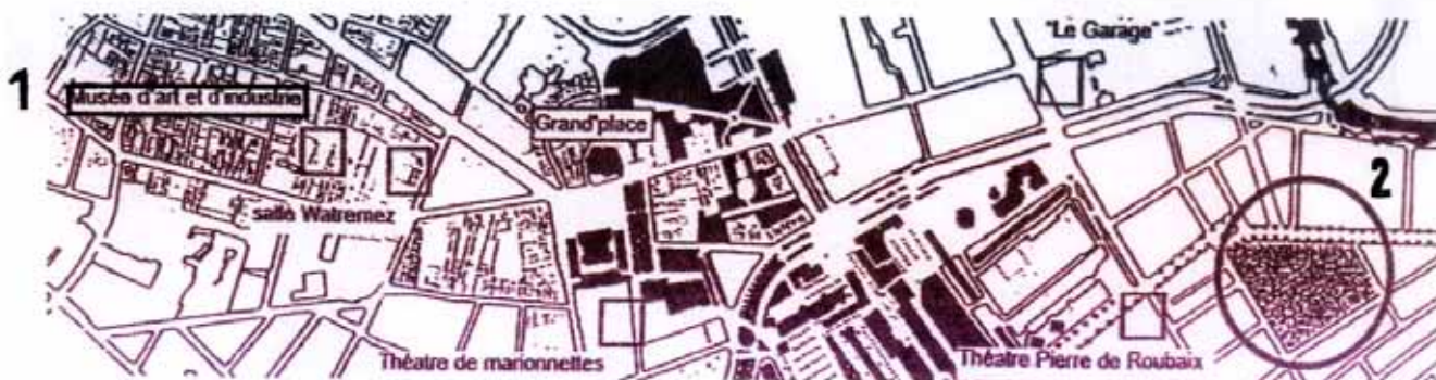
Fig.1 Centrul orașului Roubaix: 1- Muzeul de Artă și Industrie 2 – Viitorul Centru cultural

Notă: Deschiderea liniei de Metrou din Lille facilitează accesul în centrul Roubaix (Grand'Place de l'Hôtel de Ville, la câțiva pași de MAIR). Cu deschiderea Muzeului de Arte Frumoase din Lille și a Muzeului de Artă Modernă din Villeneuve d'Ascq (unul din cele mai importante din Franța), s-a constituit împreună cu «Arhive ale locului de muncă» un extraordinar triumf muzeal, în care punerea în valoare a piscinei din Roubaix își aduce mărturia asupra trecutului apropiat.