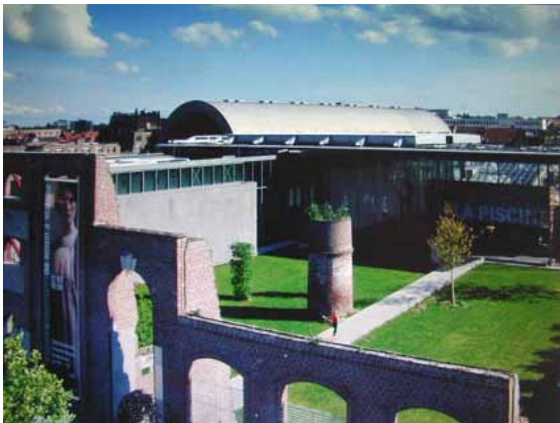
Fig.2 Vedere generală