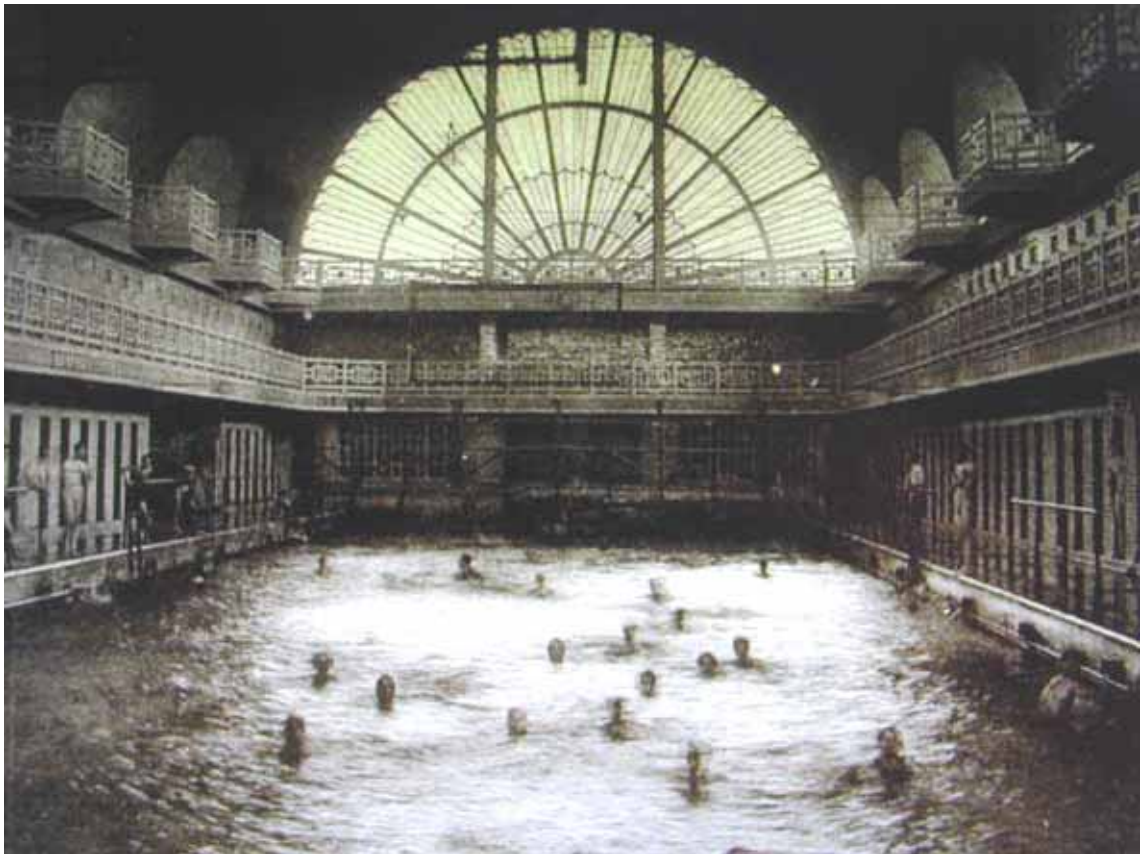
Fig.4 Piscina (imagine de epocă)