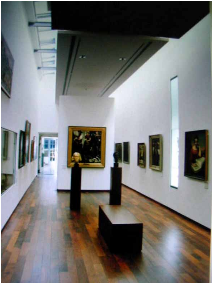
Fig.6 O sală de expoziție